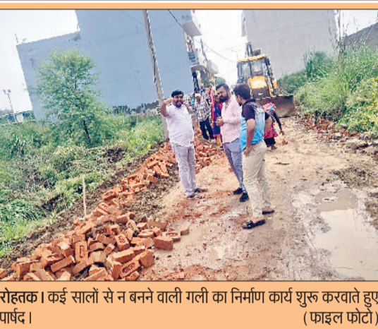
रोहतक। कई सालों से न बनने वाली गली का निर्माण कार्य शुरू कराते हुए पाषंड।

मुख्यमंत्री नाथ सिंह सेमी द्वारा विधानसभा में बताया गया कि तिलथार पर्यटन केंद्र के पास नगर निगम की जमीन पर जलघर बनाने की योजना को मंजूरी दी गई है। इसके लिए जमीन जन स्वास्थ्य विभाग को सौंपी जाएगी। हालांकि कोर्ट ने साफ कर दिया कि ट्रंप को दुनिया के हर देश पर टैरिफ लगाने का कानूनी अधिकार नहीं दिया जा सकता है।