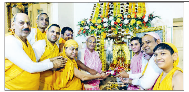
रोहतक। सराय मोहल्ला में स्थित श्री दिगम्बर जैन मंदिर में पूजा अर्चना करते भक्तजन।